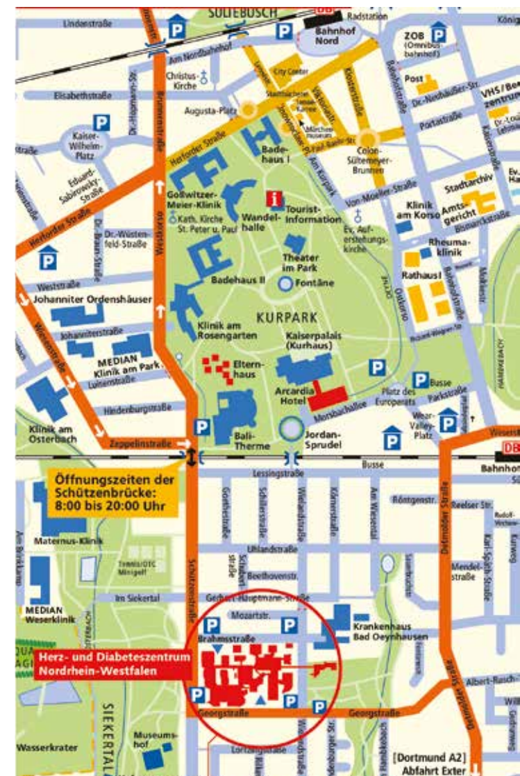
Herz- und Diabeteszentrum NRW