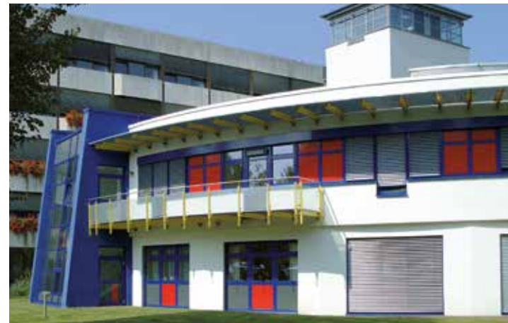
Das Kinderherzzentrum und Zentrum für angeborene Herzfehler, Bad Oeynhausen.

Wochen bis Monaten eine gute bis sehr gute Lebensqualität. Der Besuch des Kindergartens und der Schule sowie die Eingliederung in eine Berufsausbildung sind meist ohne Schwierigkeiten möglich. Die körperliche Belastbarkeit ist überwiegend normal, auch können die Kinder am Schul- oder Vereinssport teilnehmen. Komplikationen treten meist frühpostoperativ auf, später ist die Komplikationsrate deutlich geringer. Die Gesamtüberlebensrate nach zehn Jahren (früh- und spätpostoperative Todesfälle eingeschlossen) beträgt heute etwa 70 bis 80 Prozent.