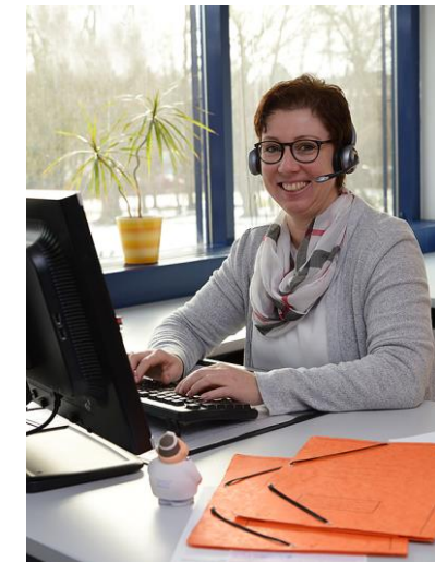
Unsere telemedizinischen Betreuerinnen freuen sich auf Ihren Anruf

Sobald Auffälligkeiten festgestellt werden, besprechen die IFAT-Ärzte die Befunde und mögliche Empfehlungen mit Ihnen und Ihrem Arzt.