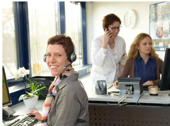
Abbildung 2: Unsere telemedizinischen Betreuerinnen freuen sich auf Ihren Anruf

Interessierte können sich über verschiedene Wege bei uns melden: Sie erreichen uns telefonisch, per E-Mail oder Fax. Gern senden wir Ihnen weitere Informationen zu den Programmen zu.